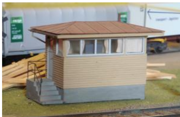
Stig Nybergs superdetaljerade modell