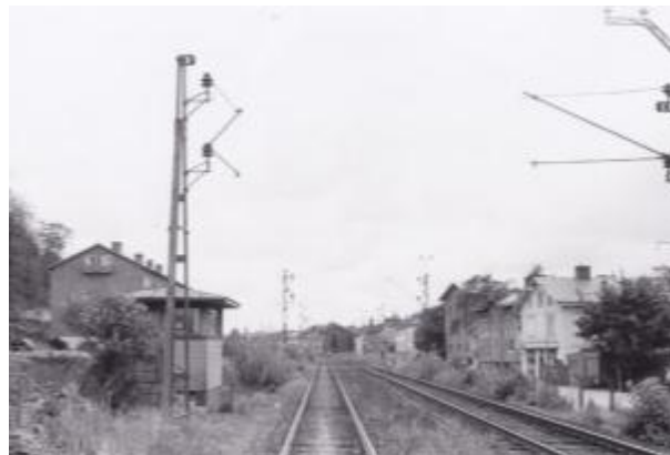
Väst kustbanan gemensam med Göteborg-Borås Järnväg genom Gårda