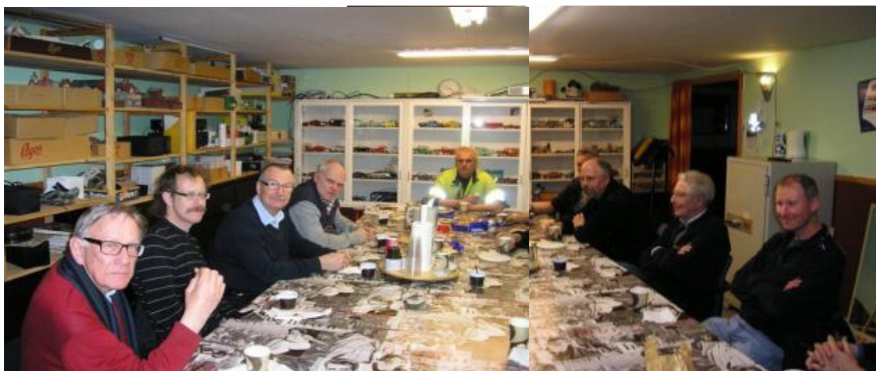
Kaffet lät sig väl smaka